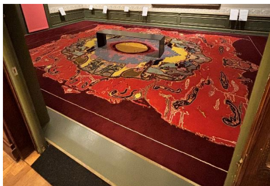
In de zaal op de tweede verdieping is een bontgekleurd tapijt te zien

In het woonhuis wordt twee keer per jaar een tijdelijke tentoonstellingen georganiseerd. Deze tentoonstellingen zijn verdeeld over vier zalen, die licht ontvangen vanuit de tuin. Wanneer je op de tweede verdieping vanuit de Grote Colenbranderzaal naar de Kleine Colenbranderzaal loopt vind je daar een bontgekleurd tapijt. Dit tapijt kan als prikkelgevoelig worden ervaren.