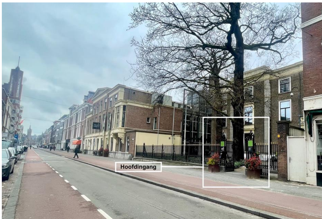
Zo ziet de weg eruit waar het museum aan ligt.