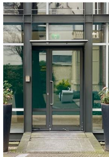
Dit is de entree deur.