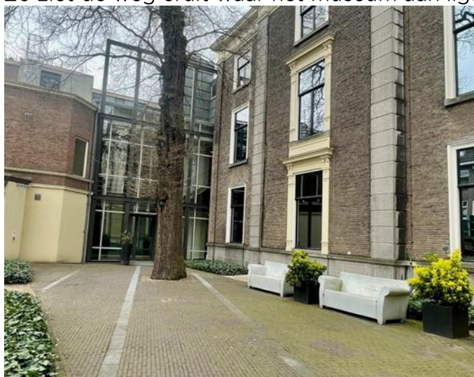
Dit is de hoofdingang vanaf de tuin gezien.