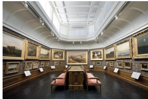
In deze zaal op de tweede verdieping hangen de schilderijen boven elkaar.